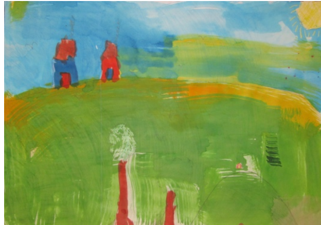
Nicolás Contador Erbaun Un Día Soleado Colegio Seminario Pontificio Menor