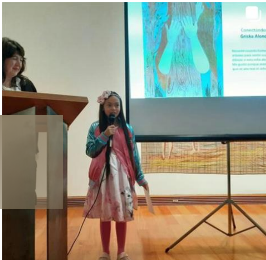
Inauguración Exposición obras seleccionadas en el Museo de Artes Visuales MAVI

Anualmente se lleva a cabo el Concurso Internacional de Pintura Infantil MOA como parte del Proyecto Educación de los Sentimientos del MOA Museum of Arts en la Ciudad de Atami- Japón. Participan niños de 6 a 12 años. Este año 2019, participaron 26 escuelas con 1361 obras. Nos alegra que dos obras chilenas fueran destacadas recibiendo menciones honorosas. Felicitamos a todos los niños sus profesores y familiares que apoyaron esta iniciativa participando.