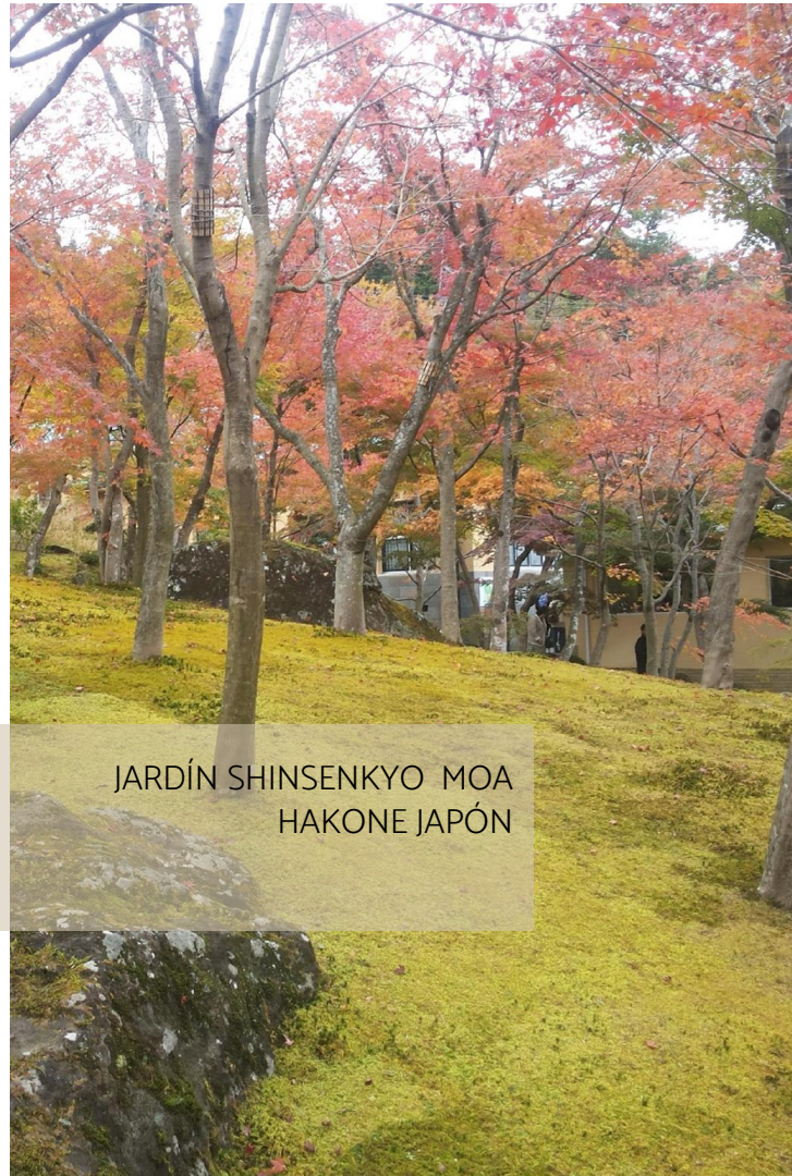
JARDÍN SHINSENKYO MOA HAKONE JAPÓN

Con esta finalidad, Okada propone su sistema de bienestar y salud integrativo, dirigido a todos los aspectos de la vida humana, principalmente a los campos de la medicina, la agricultura, las artes y la educación, orientando con sus ensayos sobre la existencia humana (física, mental y espiritual) y proponiendo un proceso de cambio de mirada y hábitos necesarios para avanzar, con propósito en la vida, hacia un bien mayor como sociedad.